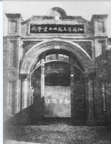
抗战胜利后的苏州工专

摘要: 1921—1925年秦邦宪在苏州工专读书期间,其思想由朦胧的爱国主义向反帝反封建方向发展。经过五卅运动洗礼,他逐渐信仰马克思主义。